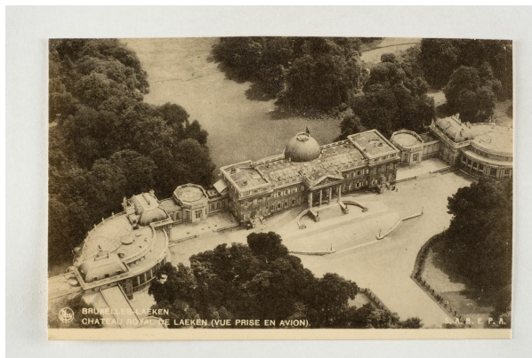
Het Koninklijk Kasteel van Laken, 1906, Verzameling Belfius Bank - Académie royale de Belgique ©ARB-urban.brussels