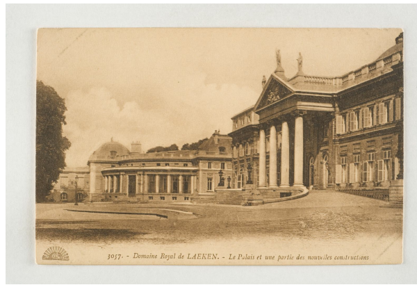
Het Koninklijk Kasteel van Laken, s.d