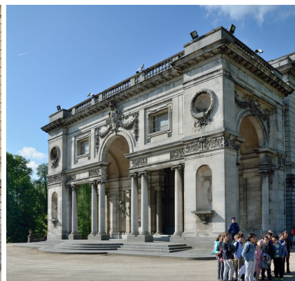
Het Koninklijk Kasteel van Laken, detail, 2020