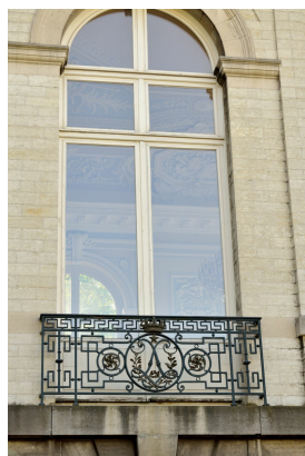
Het Koninklijk Kasteel van Laken, detail, 2020