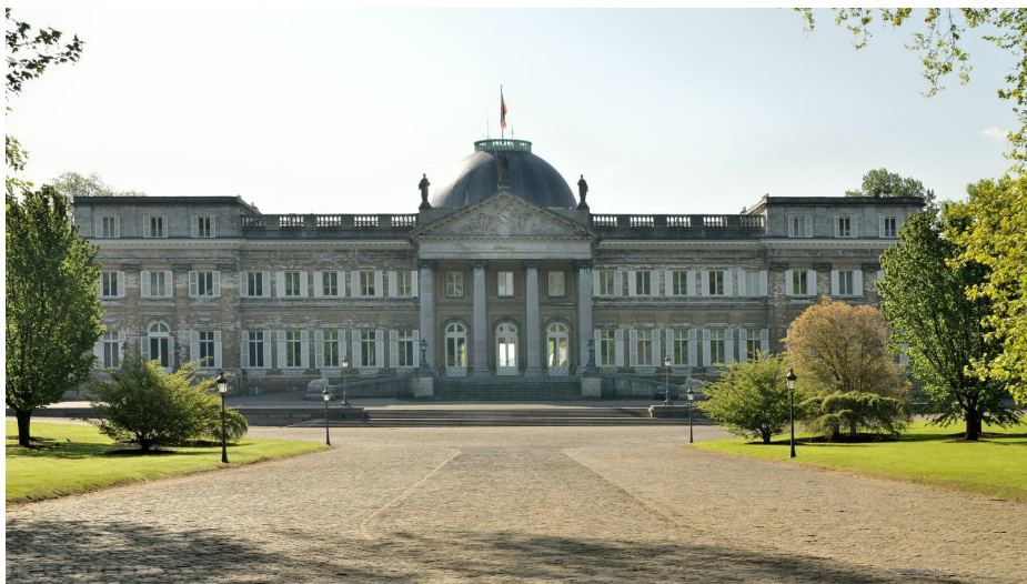
Het Koninklijk Kasteel van Laken, gevel aan de laan, 2020

Brussels Hoofdstedelijk Gewest INVENTARIS VAN HET BOUWKUNDIG ERFGOED