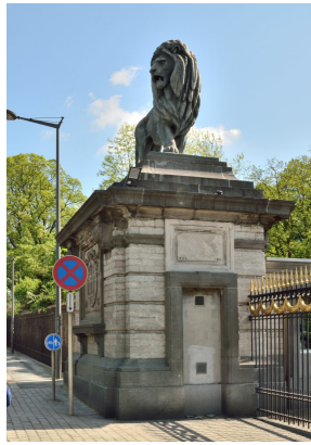
Het Koninklijk Kasteel van Laken, ingang, 2020