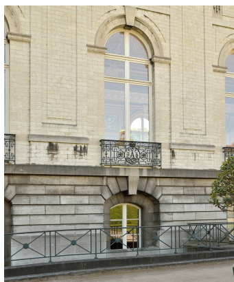
Het Koninklijk Kasteel van Laken, detail, 2020

Cosyn, A., "Les origines du domaine royal de Schoonenberg à Laeken-Bruxelles", Annales de la Société royale d'Archéologie de Bruxelles , 32, 1926, pp. 109-181.