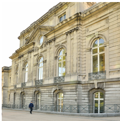
Het Koninklijk Kasteel van Laken, detail, 2020