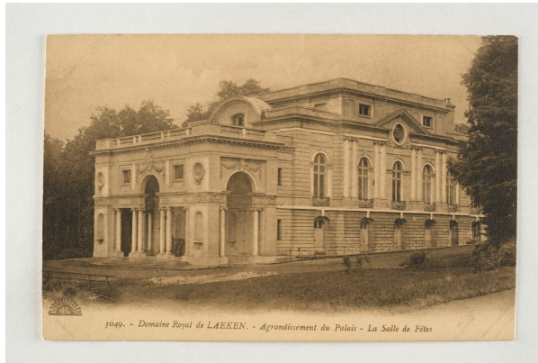
Het Koninklijk Kasteel van Laken, feestzaal, s.d., Verzameling Belfius Bank - Académie royale de Belgique ©ARB-urban.brussels