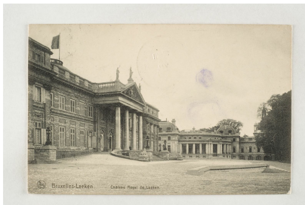
Het Koninklijk Kasteel van Laken, 1913, Verzameling Belfius Bank - Académie royale de Belgique ©ARB-urban.brussels